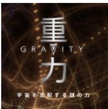
宇宙を支配する謎の力

今後注目されるであろうこの話題を「重力」とセットでお客様に紹介されてみてはいかがでしょうか。